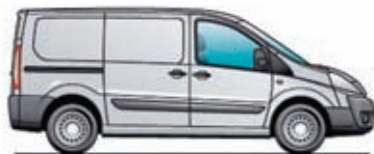
L1H1 – Șasiu scurt