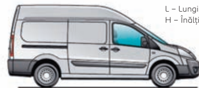
L2H2 – Caroserie supraînălțată