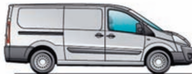
L2H1 – Șasiu lung